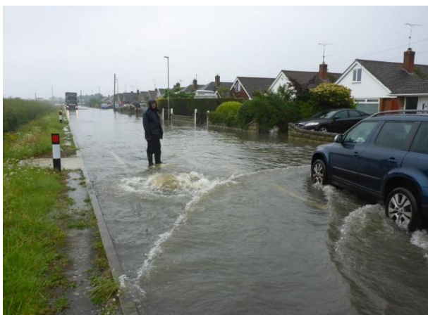
Ffordd Derwen, Rhyl, July 2018