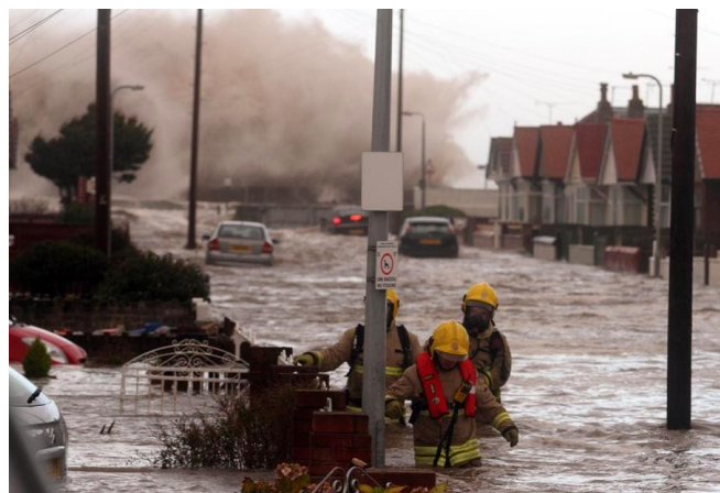
East Rhyl, December 2013