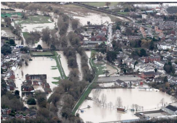
St Asaph, November 2012