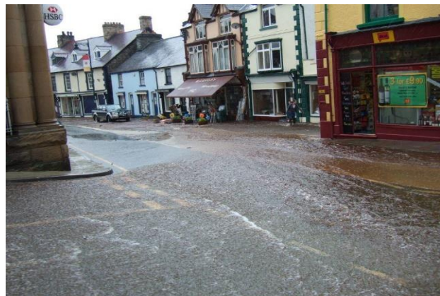
Corwen, June 2007